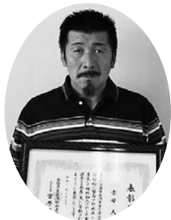
雲母 大 様